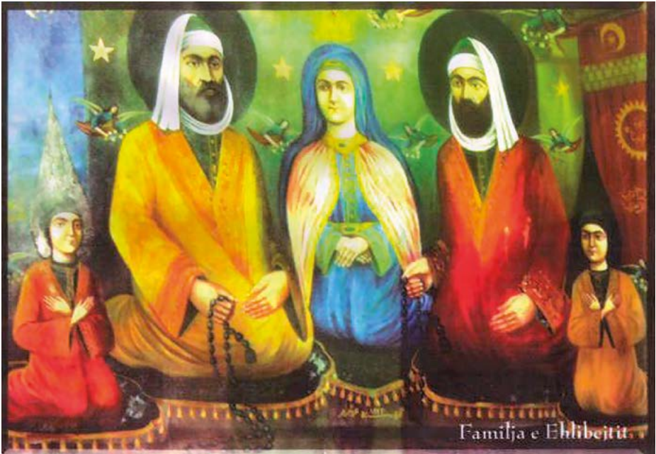
Ehl-i Beyt (pence-i ali aba), die auserwählten Nachkommen des Propheten Hz. Muhammed; v.l.: Hz. Hasan, Hz. Muhammed, Hz. Fatma, Hz. Ali, Hz. Hüseyin 4

ihrer Schwangerschaft. Muhammed fragte: „Mutter, willst du mir dein ungeborenes Kind, wenn es ein Junge ist, schenken?“ Die Antwort lautete: „Bei Gott, dieses Kind ist mein Geschenk an dich“. Es heißt weiter, dass Muhammed Gott für das Wohl und die Gesundheit des Ungeborenen um Hilfe bat. Im neunten Monat der Schwangerschaft wurde Ali inmitten der Kaaba geboren: Alis heiliges Licht erschien. Weiterhin heißt es, dass Muhammed Ali seinen Erstnamen „Ali“ und Alis Mutter ihm seinen Zweitnamen „Haydar“ (Löwe) gab. So fing mit Alis Geburt die göttlich vorherbestimmte Wegbruderschaft Muhammeds und Alis an, die bis zum Tode des Propheten ungebrochen anhielt. 5 Nach alevitischer Auffassung gibt Gott seit Adam sein göttliches Licht an die von ihm auserwählten Propheten weiter, in deren Leben sich dann eine heilige Kraft befindet. Dieses göttliche Licht teilte sich, als der Prophet Muhammed ausgewählt wurde, in zwei Lichter und leuchtete von da an sowohl auf der Stirn des Propheten als auch auf